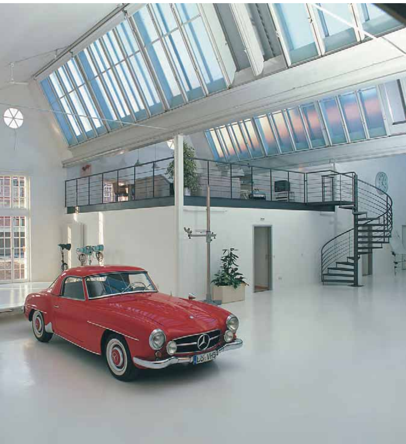
Rotes Chassis im weißen Studio – der Arbeitsort ist bei Rudi Goedtler zugleich Kulisse